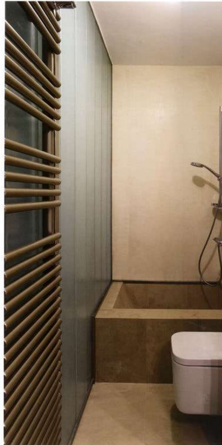
11, 12 Λεπτομέρειες από τα λουτρά του διαμερίσματος. Details of the apartment's bathrooms.