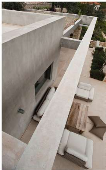
Πάγκοις σιμωμένου σφραγιστάτος.