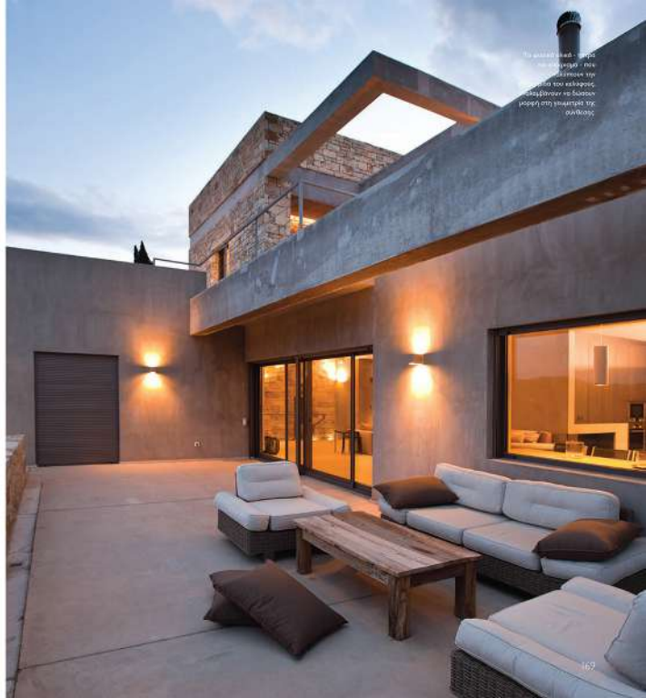
Το οικόπεδο είναι ημι-επιβλητικό - στην κλίση του οικόπεδου, η κατοικία αναπτύσσεται με διάφορα επίπεδα που εναρμονίζονται με τη μορφή της γειωμετρίας της σύνθεσης.

The aim of the architectural concept was the interaction between a contemporary building and its traditional surrounding and natural landscape. The entrance use of local stone, the massive concrete pergola and the earth care contribute to access the dialog between tradition and modernity.