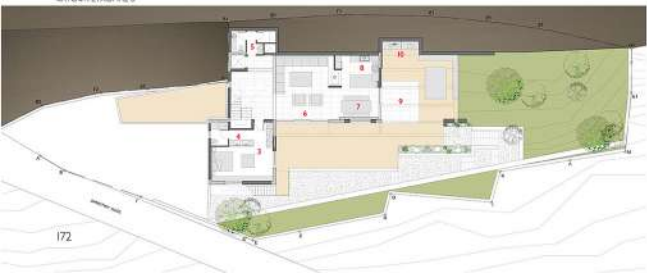
ΚΑΤΩΦΛΗ ΣΤΑΘΜΗ Θ