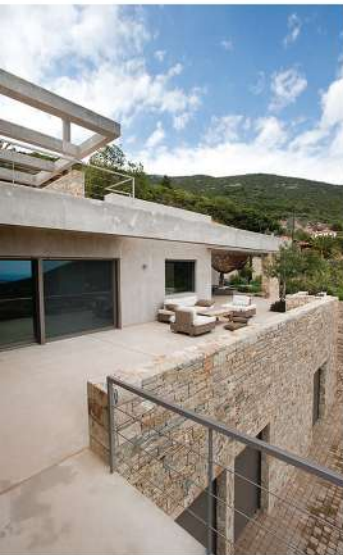
Το βιολό δάπεδο του κεκλιμένου επιπέδου σιμώθηκε με λεπτομερή προεργασία των κόνκρετ θεμελιώσεων.