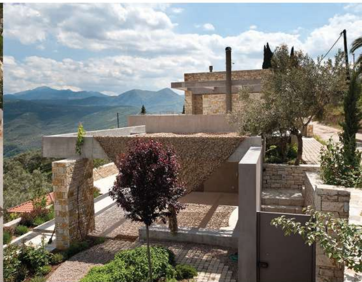
Οι γήινοι τόνοι επαναλαμβάνονται στα υλικά που ελέγχουν και τις διαδρομές των σιδηρών κλώνων.