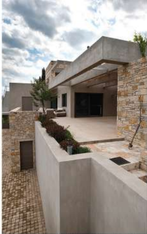
Η κεντρική ανατολική-ανατολική οδό είναι η αρχιτεκτονική οδό που οδηγεί στην κεντρική αίθουσα.