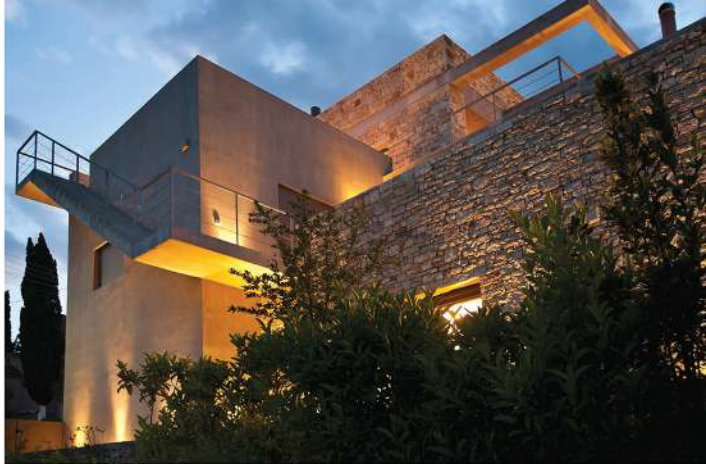
Σύνθεση στεφάνου πάνω διακοσμητικός σόλος.