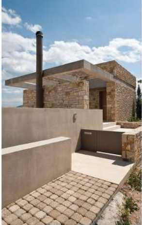
Ο χώρος εισόδου.