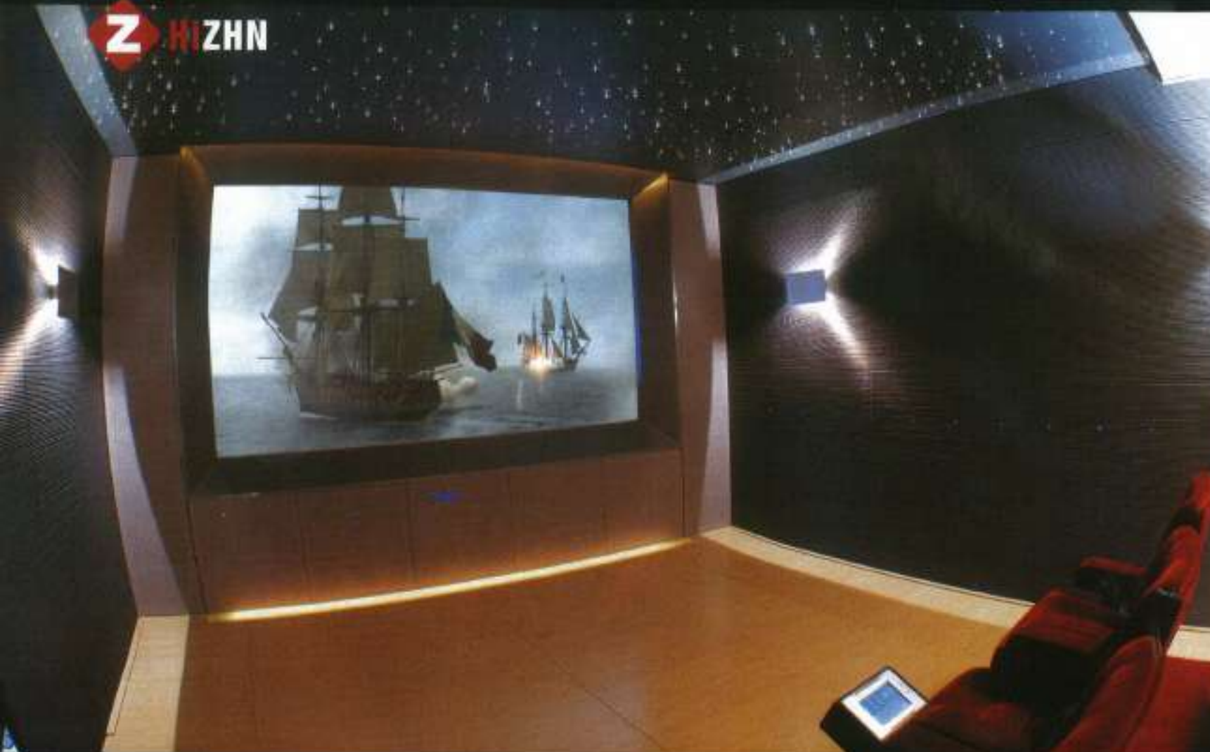
Οι οπτικές ίνες στην οροφή και τα μπλε led στο ανάγλυφο ξύλινο πάνελ είναι το κερσάκι ή πιο σωστά το κεράκι στην τούρτα. Ανάμεσα στα κεντρικά καθίσματα της πρώτης σειράς βλέπουμε την οθόνη αφής του συστήματος τηλεχειρισμού της Cue.