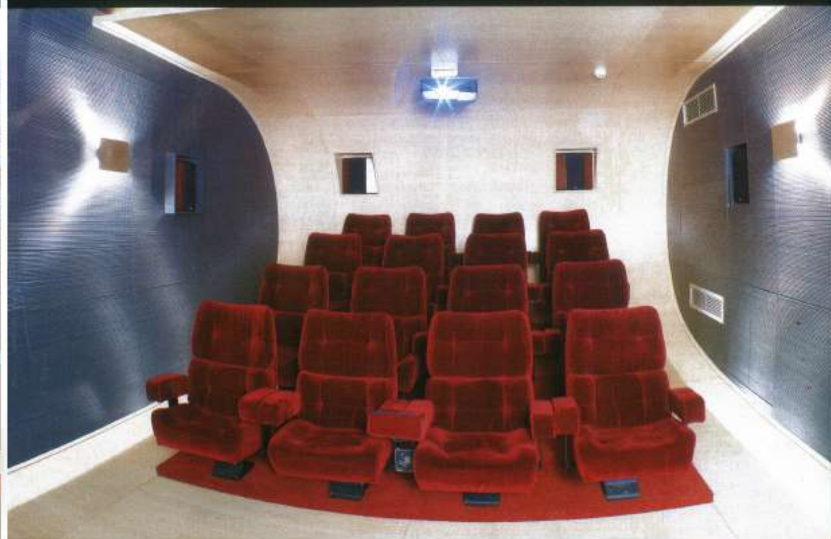
Δεκαέξι αναπαυτικές πολυθρόνες για αξέχαστα κινηματογραφικά ταξίδια. Προσέξτε την κυρτή πίσω επιφάνεια που προσθέτει και αυτή στην ακουστική του χώρου.