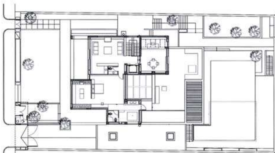
ΚΑΤΟΨΗ Β' ΣΤΑΘΜΗΣ B' LEVEL FLOOR PLAN