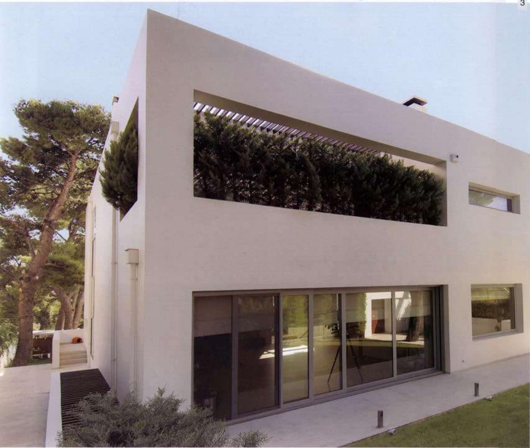
3 Άποψη της κατοικίας από την πλευρά του δρόμου. View of the residence from the street.