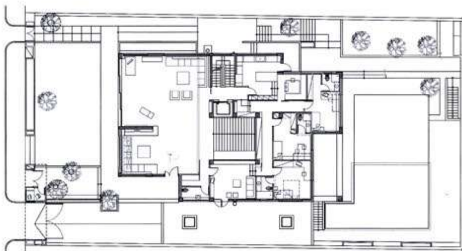
ΚΑΤΟΨΗ Α' ΣΤΑΘΜΗΣ A' LEVEL FLOOR PLAN