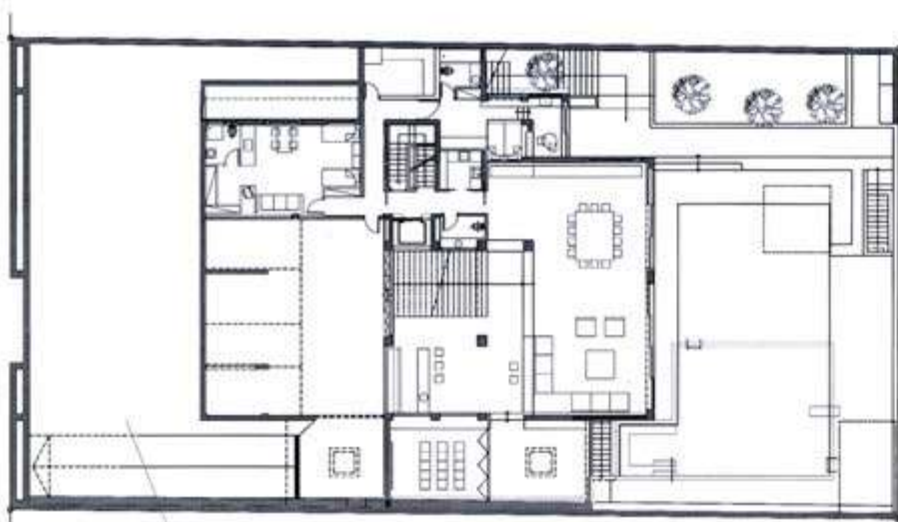
ΚΑΤΟΨΗ ΕΣΟΓΕΙΟΥ GROUND FLOOR PLAN